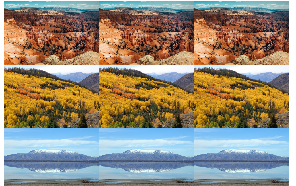
1.2 Je peux identifier et comparer 3 caractéristiques physiques d'un désert, d'une forêt, et d'une zone humide d'Utah. les photos grâce à Pixabay.com